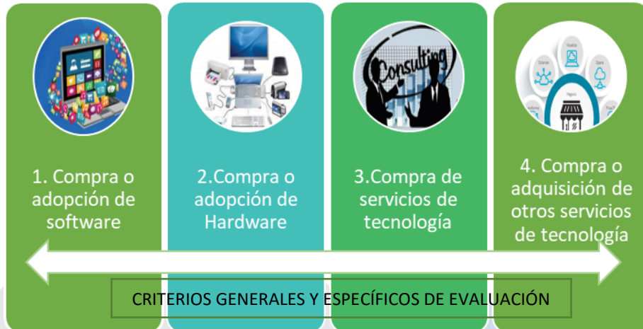
Clasificación de las compras

En este sentido, se van a abordar los criterios generales de evaluación para las compras de TI en el Ministerio y en seguida los criterios específicos aplicables a cada categoría o tipo.